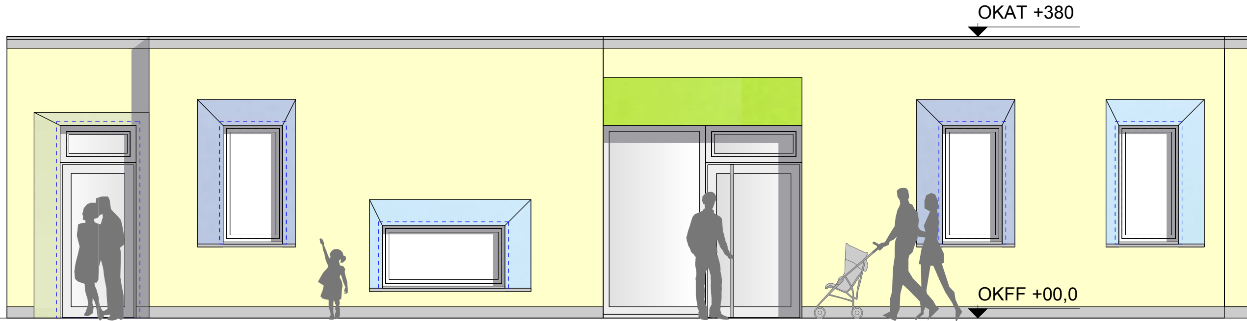
Ansicht 1 M1:100

Hinweise: Die Architekturzeichnungen sind nur in Verbindung mit den Zeichnungen der einzelnen Fachplaner und den statischen Konstruktionsplänen gültig. Abbrucharbeiten sind vor Ausführung mit dem Statiker abzustimmen. Alle tragenden Bauteile müssen nach geprüfter statischer Berechnung hergestellt werden. Detailverweise des Architekten sind unbedingt zu beachten. Die angegebenen Türhöhen geben das lichte Maß von OKFF bis UK Rohsturz an. Die Brüstungshöhen beziehen sich auf OKFF. Alle Maße sind vom Auftragnehmer eigenverantwortlich vor Ort zu prüfen! Unstimmigkeiten sind vor Ausführung mit der Bauleitung abzustimmen. Die Pläne bzw. deren Inhalt bleiben geistiges Eigentum des Planverfassers. Weitergabe an Dritte bedarf der Zustimmung.